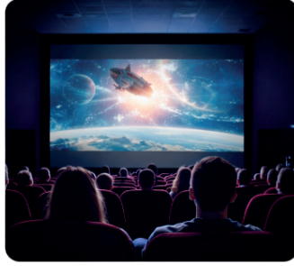
Sinema Etkinliği: 180 TL

4. Bir okulda yıl sonu etkinlikleri kapsamında düzenlenen iki farklı organizasyon aşağıda verilmiştir.